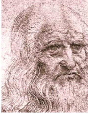
চিত্র : লিওনার্দো দা ভিঞ্চি

দাবি করেন যে ছবিটি হয়তো ফ্লোরেন্সে আঁকা শুরু হয়েছে কিন্তু শেষ হয়েছে কয়েক বছর পর মিলানে। শুধু কোন সময়ে আঁকা হয়েছে তাই নয়, ঐতিহাসিকেরা এটা জানারও চেষ্টা করেছেন যে, কেন লিওনার্দো এই প্রতিকৃতিটি আঁকতে গেলেন? কেউ কি তাকে এটা করে দিতে বলেছিল? যদি তাই হয়, তবে কে সে? লিওনার্দো তার অন্য সব চিত্রকর্মই বায়নাকারীদের দিয়ে দিয়েছেন, কিন্তু মোনালিসার ক্ষেত্রেই তার একমাত্র ব্যতিক্রম ঘটেছে। তিনি এটাকে তার সাথেই রেখে দিয়েছিলেন দীর্ঘদিন। কেন এটা বায়নাকারীকে কখনোই দেওয়া হয়নি? এই সমস্ত প্রশ্নের কোন সদুত্তর এখনো পাওয়া যায়নি।