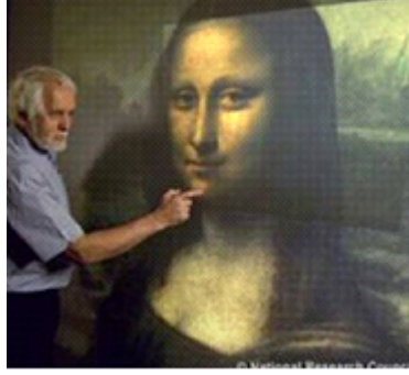
চিত্র : ত্রিমাত্রিক বিশ্লেষণে মোনালিসার ছবি

লিওনার্দো তার এই অংকন কৌশলকে ফুমাটো বলতেন। ইতালীয়ানে যার অর্থ হচ্ছে ধোঁয়া। কিন্তু ধোঁয়ার মধ্যে সত্যিকারের যা হারিয়ে গেছে তা হচ্ছে কিভাবে এই কৌশল মোনালিসাতে প্রয়োগ করেছিলেন ভিঞ্চি।