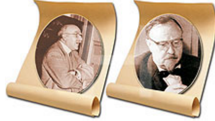
চিত্র ৪.২: জেবি এস হালডেন (বামে) আলেক্সান্দার ওপারিন (ডানে)

ওপারিন আর হালডেন দু’জনেই তাদের লেখায় বললেন, সাড়ে চারশ কোটি বছর আগেকার পৃথিবী কিন্তু কোন দিক দিয়েই আজকের পৃথিবীর মত ছিল না। এ সময় পৃথিবী ছিল প্রচন্ড গরম, অনেকের মতে তাপমাত্রা ছিল প্রায় ৫০০০-৬০০০ ডিগ্রীর মত। পানি পড়া মাত্রই তা বাষ্প হয়ে উড়ে চলে যেত।