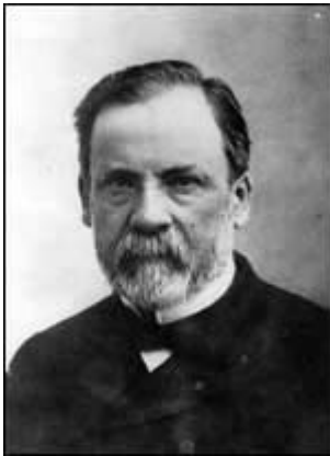
চিত্র ৪.১: লুই পাস্তুর (১৮২২-১৮৯৫)।

‘স্বতঃজননবাদ’কে (Theory of spontaneous generation) হটিয়ে দেওয়ার কৃতিত্ব অহরহই লুই পাস্তুরকে দেওয়া হয়ে থাকে। কিন্তু এটিও সত্য যে, স্বতঃজননের মাধ্যমে প্রাণ যে কখনই উৎপত্তি হতে পারবে না - এমন ধারণায় পাস্তুর নিজে কখনই নিঃসন্দেহ ছিলেন না। পাস্তুর এ নিয়ে একবার এমন মন্তব্যও করেছেন, তার বিশ বছরের ক্লাস্টিহীন গবেষণায় কখনও মনে হয় নি যে, এভাবে প্রাণের উদ্ভব একেবারেই অসম্ভব। আসলে পাস্তুর তাঁর বিখ্যাত পরীক্ষার সাহায্যে যেটা দেখিয়েছিলেন তা হল, জীবাণুমুক্ত নিয়ন্ত্রিত (পাস্তুর প্রদত্ত) পরিবেশে প্রাণ আপনা আপনি জন্ম নেয় না; কিন্তু অন্য পরিবেশে অন্য ভাবে যে কখনই জন্ম নিতে পারবে না - এই কথা কিন্তু পাস্তুরের ফলাফল হ্রাস করে বলছে না। ব্যাপারটা একটু পরিস্কার করা প্রয়োজন।