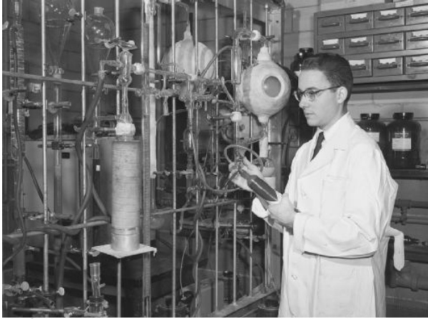
চিত্র 8.৫ গবেষণাগারে গবেষণারত স্ট্যানলি এল. মিলার (১৯৫৩ সালে তোলা ছবি)

পরবর্তী সময়ে মিলার ও ইউরে (১৯৫৫), মিলার ও ওর্গেল (১৯৭৪), মিলার (১৯৮৭) একই পদ্ধতিতে ২০টির মধ্যে ১৮ টি জৈব এসিড এভাবে তৈরী করেছিলেন। তাদের পরীক্ষাই সর্বপ্রথম প্রমাণ করে ওপারিনের অনুকল্প সঠিক; অর্থাৎ, আদিম বিজারকীয় পরিবেশে সত্যিই অজৈব পদার্থ থেকে জৈব পদার্থের উন্মেষ ঘটেছিল। এ আবিষ্কারের জন্য ইউরে (দ্বিতীয়বার) এবং মিলার নোবেল পুরস্কার লাভ করেন।