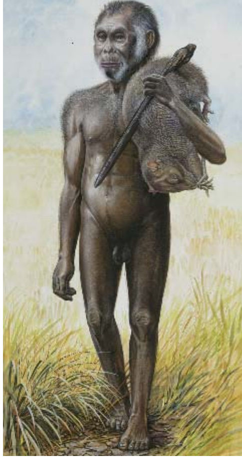
ছবি ১: বামন মানুষের সম্ভাব্য প্রতিকৃতি

সম্ভবত অনেক আগেই বিলুপ্ত হয়ে যাওয়া মানুষের আরেকটি প্রজাতি হোমো ইরেক্টাস (homo erectus) এর একটি দল এই দ্বীপে এসে বসবাস করতে শুরু করে। হাজার হাজার বছর ধরে অত্যন্ত ছোট এই দ্বীপটিতে বিচ্ছিন্নভাবে বাস করার ফলে তারা বিবর্তিত হতে হতে একসময় ভিন্ন প্রজাতিতে রূপান্তরিত হয়েছিল। তাদের ফসিলের আশে পাশে একধরনের বামন হাতি এবং কমডো ড্রাগন সহ অন্যান্য বেশ কিছু প্রাণীর ফসিলও পাওয়া গেছে।