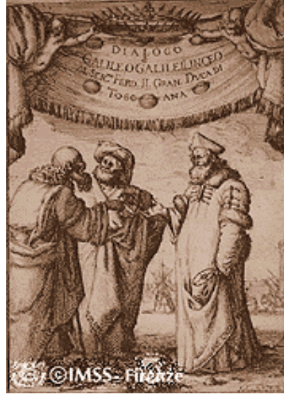
Dialogue Concerning the Two Chief Systems of the World - Ptolemaic and Copernican

সাধারণ জনগণের কথা মনে রেখে বইটি লেখা হয়েছিল ইতালীয় ভাষায় - খুবই আকর্ষণীয় ভাবে, গ্যালিলিও সৃষ্ট তিন কাল্পনিক চরিত্রের নিজেদের মধ্যে কথোপকথনের ভিত্তিতে। এই তিন চরিত্রের একজন ছিলেন কোপার্নিকাসের সূর্যকেন্দ্রিক তত্ত্বের প্রবল সমর্থক - নাম সালভিয়াতি, আরেকজন অ্যারিস্টটলীয় দার্শনিক যিনি টলেমীর ভূ-কেন্দ্রিক তত্ত্বের সমর্থক - নাম সিম্প্রিসিও, আর তৃতীয়জন (সাগ্রেদো) মোটামুটি নিরপেক্ষ। বইটিতে গ্যালিলিও তাঁর সূর্যকেন্দ্রিক তত্ত্বের প্রতি প্রবল অনুরাগ কিন্তু ঢেকে রাখতে পারেন নি।