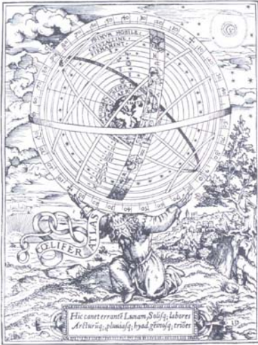
আটলাসের কাঁধে বিশ্বব্রহ্মাণ্ড। পৃথিবী এর কেন্দ্রে।

গ্যালিলিওর কথা শুরু করার আগে প্রথমে এই বিশ্বব্রহ্মাণ্ডের ব্যাপারে সে সময়কার জ্যোতির্বিদদের ধ্যান-ধারণাগুলো একটু ঝালিয়ে নেওয়া যাক। আসলে পৃথিবী যে গোল এবং গতিশীল, এই ধারণায় পৌঁছাতেই মানুষের সময় লেগেছে বহুদিন। প্রাচীন কালের সাহিত্য আর ধর্মগ্রন্থ গুলো পড়লে বোঝা যায়, সে সময়র মানুষেরা শুধু পৃথিবীকে শুধু সমতলই ভাবত না, ভাবত গতিহীন - স্থির! ভাবত সারা আকাশ এই স্থির পৃথিবীর চারিদিকে ২৪ ঘন্টায় পাক খেয়ে চলেছে। এমনকি খেলসের ( ৬২৪ -৫৩৭ খ্রী.পূ) মত প্রথিতঃযশা গ্রীক বিজ্ঞানী পর্যন্ত ভাবতেন, পৃথিবী দেখতে অনেকটা সমতল চাকতির মত - জলাদির উপরে ভাসমান কর্ক খন্ড যেন! তবে মানুষ ধীরে ধীরে তার ভুল ধারণা পালটাতে পেরেছে; পেরেছে মহাকাশ নিয়ে তার অনন্ত কৌতুহল আর পর্যবেক্ষণশক্তির কারণেই। যেমন, খুব সহজেই আকাশের দিকে তাকিয়ে বুঝেছে ক্যানোপাস (Canopus) নামে উজ্জ্বল যে তারাটা আলেকজান্দ্রিয়া থেকে দৃশ্যমান, তা কিন্তু এথেনস থেকে মোটেই দেখা যায় না, দিগন্তরেখার উপরে না আসবার কারণে। আবার চন্দ্রগ্রহণের সময় মানুষ খেয়াল করে দেখেছে, চাঁদের উপরে পৃথিবীর যে ছায়া পড়ে তা গোলাকার। এভাবে বিভিন্ন ধরনের পরোক্ষ প্রমাণ পেয়ে ‘সমতল পৃথিবীর ভূত’ মাথা থেকে অবশেষে সরতে পেরেছে। তবে গ্রীক দার্শনিকরা সৌরজগতের কেন্দ্রে বসে থাকা ‘আপোষহীন পৃথিবীকে’ কু্য করে তখনও নামাতে পারেনি।